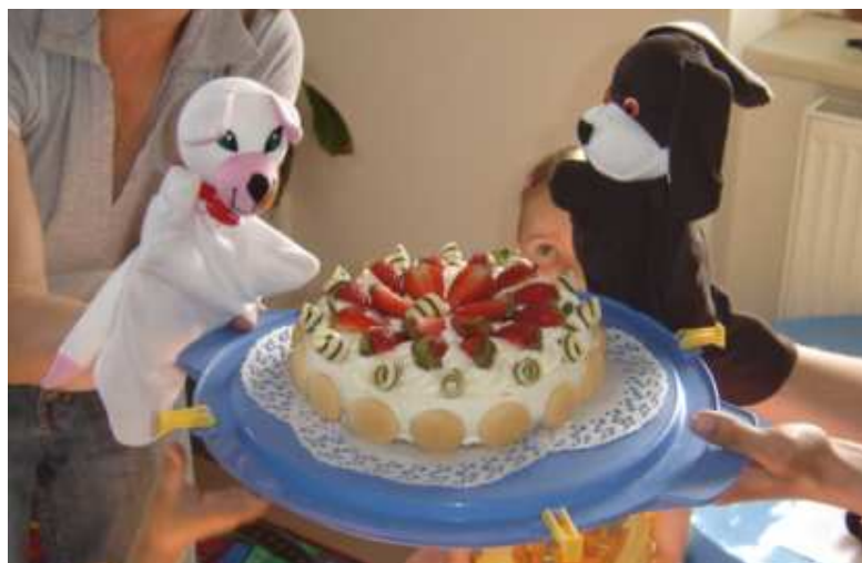
V Pelíšku se pejskovi a kočičce dort povedl

Kvalifikovaná pedagogická pracovnice s dlouholetou praxí na ZŠ. Její pracovní místo vytváří mateřské centrum ve spolupráci s Úřadem práce Kladno a s využitím příspěvku na vytváření pracovních příležitostí v rámci veřejně prospěšných prací.